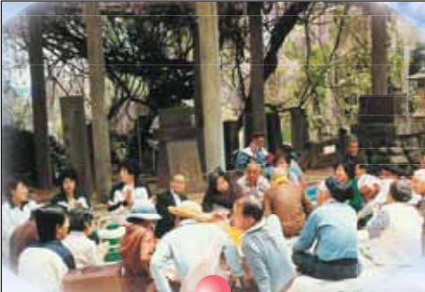
山田の藤の花見、 今でも変わらず きれいですね。