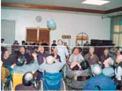
風船バレー大会。みなさん体を いっぱい動かしてハッスルされています。