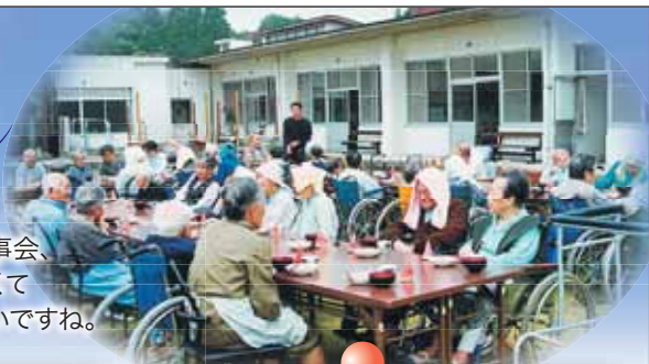
外での食事会、 天気も良くて 気持ちいいですね。