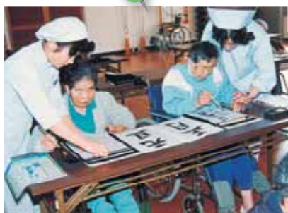
年の初めの書き初め大会。 みなさん真剣に書いておられます。