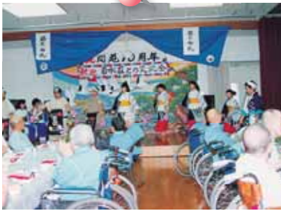
菊水荘との交流会。今でも交流を深め、 会えるのを楽しみにしています。