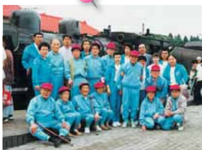
阿蘇への一泊旅行、 SLにも乗ってきました。