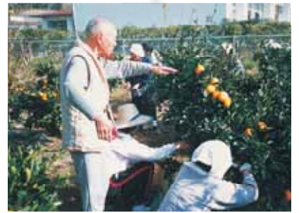
秋の味覚、みかん狩り。 昔は苑の隣で行ってました。