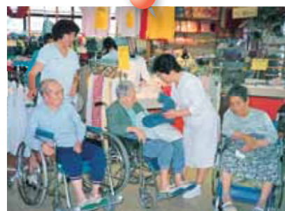
デパートでのショッピング、みなさん 自分の好きな物を買っています。