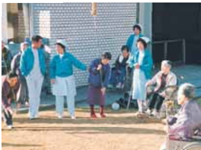
昔ながらのもぐら打ち。 力を込めて叩いておられます。