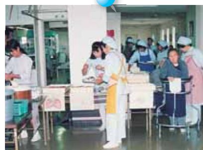
バイキング風景、 今でもみなさんに人気の行事です。