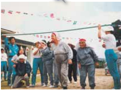
秋の大運動会、パン食い競走は 人気の競技です。