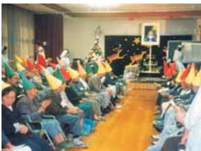
静粛な中でのクリスマス会。 みなさん一緒にメリークリスマス。