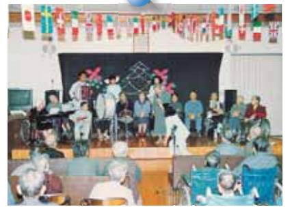
文化サークル発表会。 楽器の演奏も頑張りました。