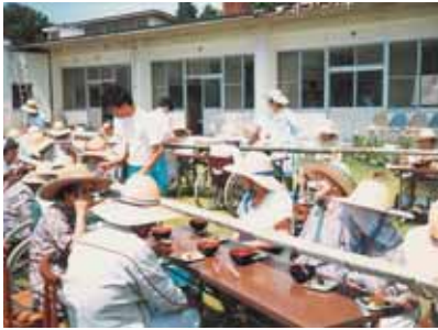
夏の名物、そうめん流し。 冷たいソーメンはおいしいですね。