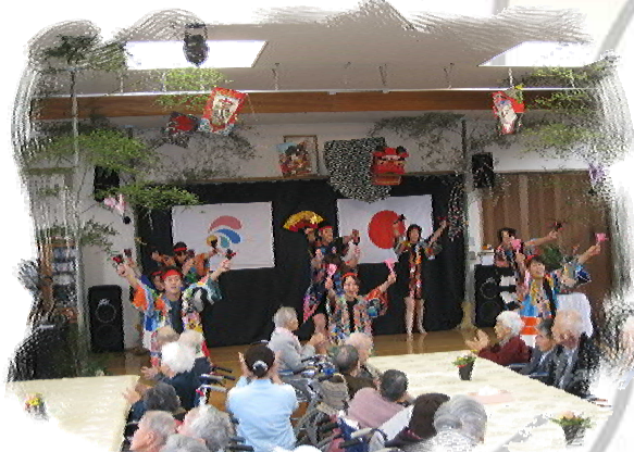
【よさこいソーラン隊の踊り】

平成21年度を迎え、皆様、新たな思いや抱負を胸に、1月1日の年賀式に参加されました。本年度も良い年になる様、職員一同力を合わせて精進して参りますので宜しくお願い致します。