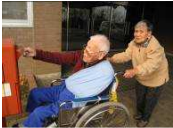
【年賀ハガキを郵送】

平成21年度を迎え、皆様、新たな思いや抱負を胸に、1月1日の年賀式に参加されました。本年度も良い年になる様、職員一同力を合わせて精進して参りますので宜しくお願い致します。