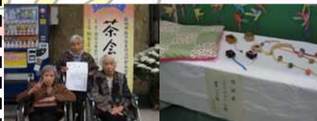
【各町代表者3名】【各町制作したクッションと小物品】

11月3日、玉名市民会館にて玉名市文化祭の表彰式が行われ、苑からも、西町は、小物品、南町は下駄とクッションを出展し、見事表彰されました。