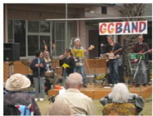
3/29 おやじバンド(GG BAND)来苑 職員も交え、盛り上がりました♪

暖かい日が増えてきましたが、まだまだインフルエンザの流行は全国的にも継続しているようなので、ご家族の皆様もご自愛いただけたらと思います。