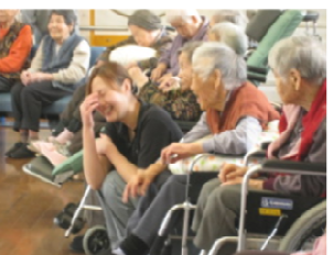
3/24 お達者クラブ この日は、“春よ来い”を手話付きで歌いました☆

岱山苑のホームページでもご覧頂けます。 taizanen.comもしくは「岱山苑」で検索！